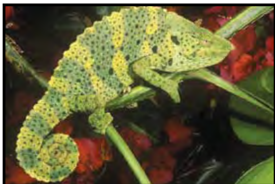
آفتاب پرست ملر